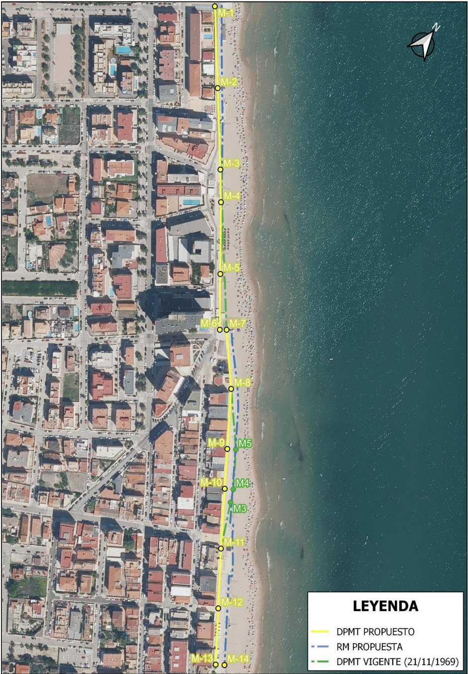
Figura 4.- Delimitación vigente, propuesta y modificada en este proyecto del dominio público marítimo-terrestre y de la ribera del mar.

Proyecto de “Deslinde de los bienes de dominio público marítimo-terrestre en el tramo de costa correspondiente al término municipal de Bellreguard (Valencia).” MEMORIA