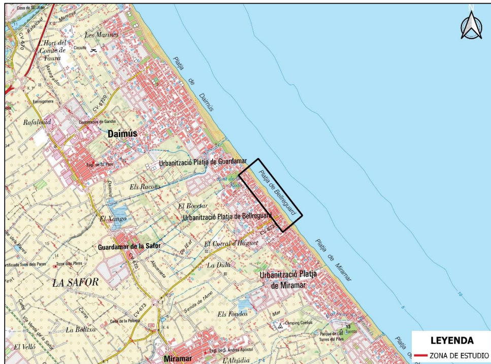
Figura 1.- Localización del tramo.

La zona objeto de estudio se enmarca en el tramo de costa situado en el término municipal de Bellreguard, en la comarca de la Safor de Valencia, limitando por la parte norte con el municipio de Guardamar de la Safor y por la parte sur con el municipio de Miramar.